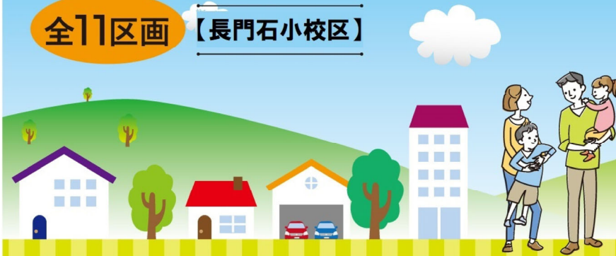
【ニコニコタウン 長門石1丁目分譲地価格表】